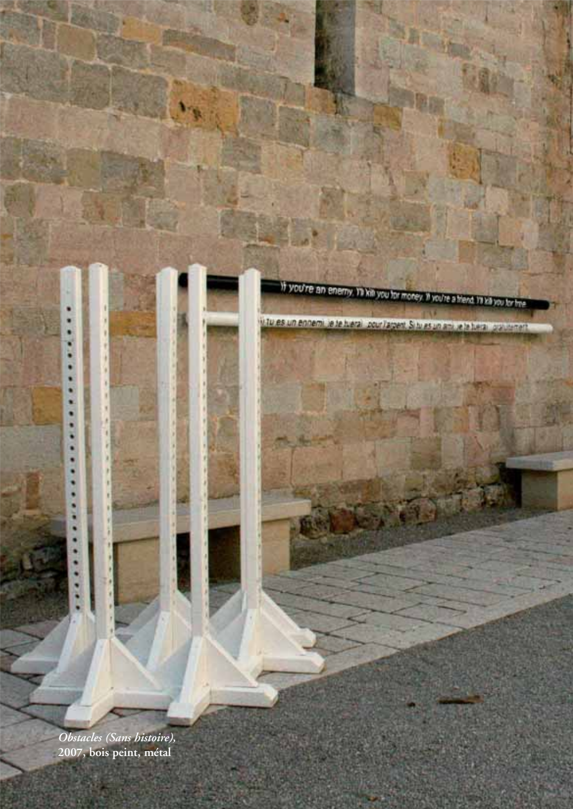
Obstacles (Sans histoire), 2007, bois peint, métal