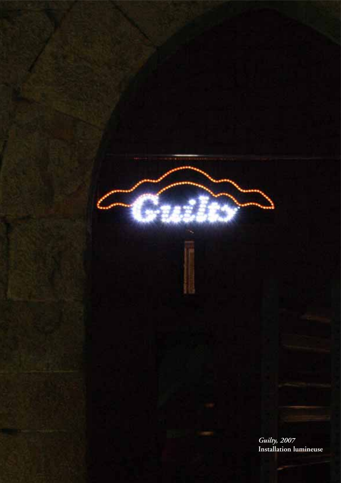
Guilty, 2007 Installation lumineuse