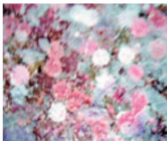
Hiver, 2005 , Jet d'encre sur toile, ©Adrian Schiess

Les Constructeurs, définitif , 1950, huile sur toile, Donation N.Léger et G.Bauquier, Musée national Fernand Léger, ©ADAGP, Paris 2008