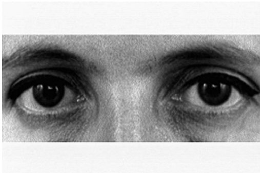
Zineb Sedira Silent sight , 2000 Vidéo-projection Format original : Film 16 mm 12 minutes Son : Edith Marie Pasquier Copyright Zineb Sedira Courtesy the artist and kamel mennour, Paris