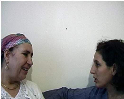
Zineb SEDIRA Mother Tongue , 2002 A - Mother and I (France) B – Daughter and I (Angleterre) C – Grandmother and Granddaughter (Algérie) Vidéo-projections sur écran plasma 5 min (Chq. vidéo)