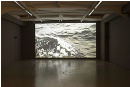
Zineb Sedira Middlesea , 2008 Vidéo-projection 16"9, 16 minutes Vues de l'exposition "Shipwreck : The death of a journey", Kamel Mennour, Paris © Zineb Sedira Photo Marc Damage Courtesy the artist and kamel mennour, Paris