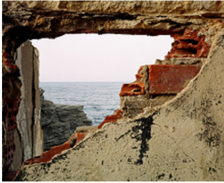
Zineb Sedira Framing the view IV, 2006 Photographie couleur 60 x 70 cm © Zineb Sedira Courtesy the artist and kamel mennour, Paris