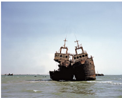
Zineb Sedira The Lovers , 2008 Photographie couleur 120 x 100 cm