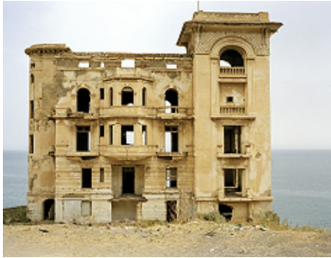
Zineb Sedira Haunted House III, 2006 Photographie couleur 80 x 100 cm