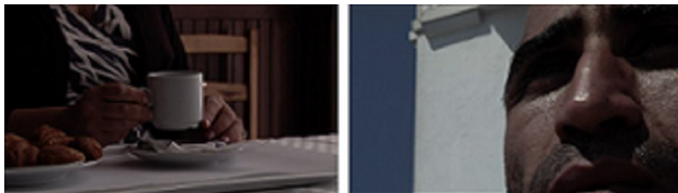
Zineb Sedira Saphir , 2006 Installation video avec double projection, son 16"9, 18 minutes © Zineb Sedira Courtesy Zineb Sedira and Kamel Mennour, Paris