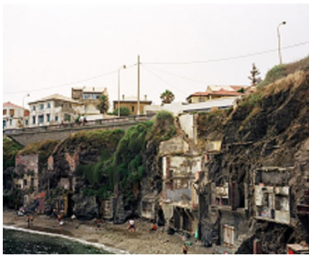
Zineb Sedira Framing the view II, 2006 Photographie couleur 60 x 70 cm © Zineb Sedira Courtesy the artist and kamel mennour, Paris