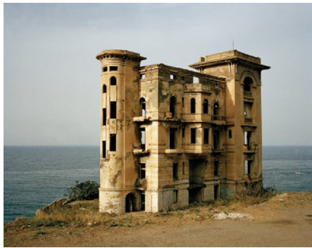
SAPHIR, détail, 2006, © ZINEB SEDIRA

Les oeuvres de Zineb Sedira, qu'elles empruntent à la vidéo, la photo, à l'installation ou au texte, sont fortement habitées par la difficile recherche identitaire de tout individu confronté à des cultures différentes. Zineb Sedira, française d'origine algérienne, vivant depuis plus de vingt ans en Grande-Bretagne, a construit son oeuvre sur le problématique phénomène d'acculturation. Les sujets qu'elle traite – la communication, le corps, l'espace, le voile, l'exil