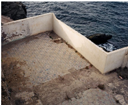
Zineb Sedira Framing the view III, 2006 Photographie couleur 60 x 70 cm