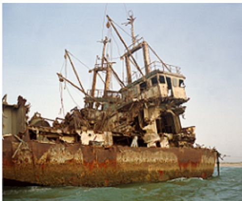
Zineb Sedira The Death of a Journey , 2008 Photographie couleur 120 x 100 cm