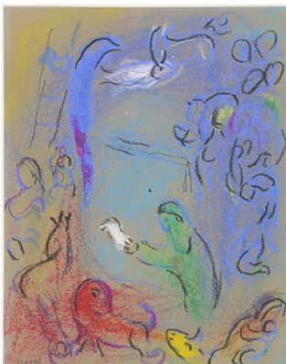
Marc Chagall, L'Arche de Noé, 1961-1966, pastel et encre de chine sur carton gris