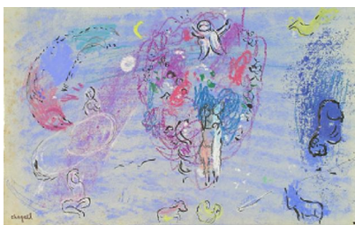
Marc Chagall, Le Paradis , 1961, pastel et encre de Chine, lavis de gouache sur papier blanc