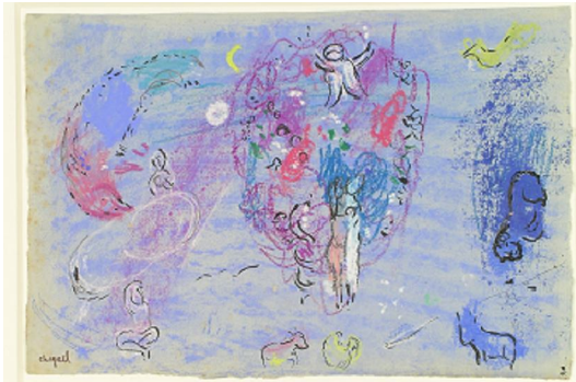
Marc Chagall, Le Paradis , 1961, pastel et encre de Chine, lavés de gouache sur papier blanc