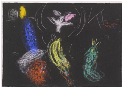
Marc Chagall, Moïse devant le Buisson Ardent, 1960-1966, pastel et encre de chine sur papier noir