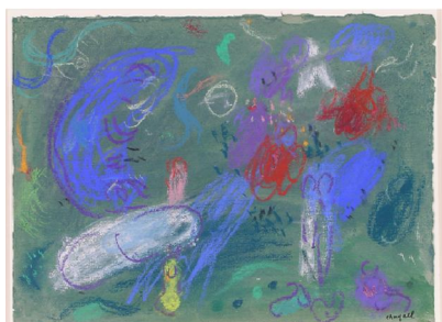
Marc Chagall, Le Paradis , 1961, pastel et encre de Chine, lavis de gouache sur papier blanc, © Musée national Marc Chagall, cliché Musée national Marc Chagall, P. Gérin © Adagp, Paris 2011