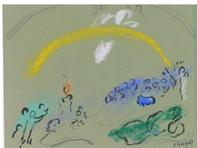
Marc Chagall, Noé et l'Arc-en-ciel, 1961-1966, pastel et encre de chine sur papier vert