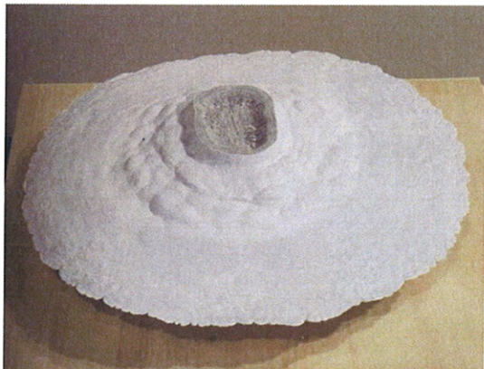
MORGANES WHITE SUGAR (1456) COMMENCÉ EN - BEGUN 2004 © ÉRIC CAMERON